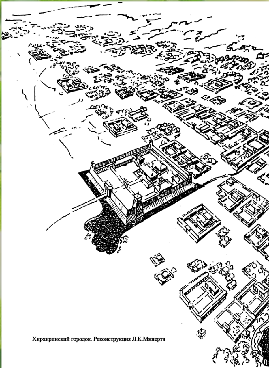
Хирхинский городок. Реконструкция Л.К.Минерта

В центре городища сохранились остатки цитадели (крепости), окруженные валом и рвом,